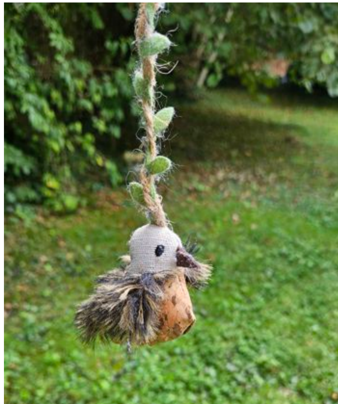
Das Katzenspielzeug – der falsche Vogel an der Leine

kamst direkt auf Mama, die auch nicht deine Mutter ist, und mich zu. Wir nahmen dich auf. Hast du denn alles vergessen? Blitzen nie Erinnerungen durch dein Gehirn? Du siehst zwar menschlich aus, aber du bist es nicht. Trotzdem hast du dich an dein Umfeld gewöhnt. Ich denke, wir sollten alles lassen, wie es ist. Es soll weitergehen wie bisher. Niemand weiß um dein wahres Wesen, nur deine vermeintlichen Eltern. So wird es auch in Zukunft sein.