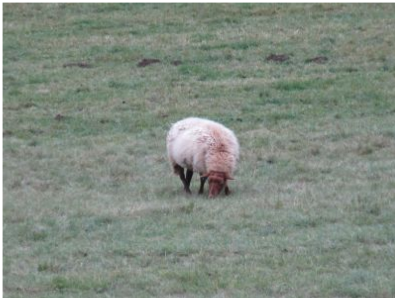
Das einzelgängerische Schaf auf der Weide

So viele Ideen sind in meinem Kopf! Gern würde ich sie zu Papier bringen, doch ich kann nicht lesen und schreiben. Ich besuchte nie eine Schule. Ich werde zuhause gebraucht. Meine Aufgabe ist es, gelegentlich auf unserem Feld zu helfen und täglich die Schafe auszuführen. Meine Eltern verlassen sich auf mich. Ich will sie nicht enttäuschen. Dazu muss ich meine Ambitionen hintanstellen.