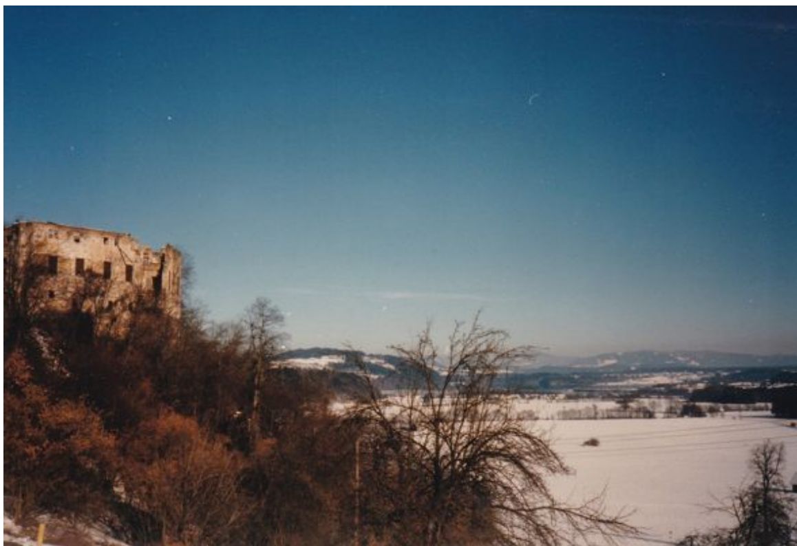
Burgruine bei Völkermarkt (1995)

Ich bin Olaf Ekholm, Mitglied der Schwedischen Akademie. Ich freue mich, Ihnen mitteilen zu dürfen, dass Ihnen der diesjährige Nobelpreis für Literatur zuerkannt wird.