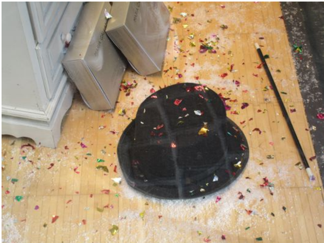
Der Zylinder und der Stab des Zauberers mit Konfetti und falschem Schnee

Angespannt warten, genau hinsehen, investigativ, weite Ärmel, „aha, so könnte es gehen“, Erwartungshaltung, das Taschentuch wird zur Taube aus dem Zylinder, und doch staunen, „aahh“, macht die Menge. Die Eltern freuen sich, dass ihre Kinder lachen, Mann nützt die Gelegenheit, legt Frau die Hand an ihre Hüfte, sie legt ihre auf seine, streichelnde Finger. Der Hut geht um, die Hilfiger-Golfer-Verschnitte und die Prada-Dämchen sind plötzlich in Eile, die klimperndsten Münzen sind die der kleinen Leute. Der Zauberer verbeugt sich tief, schwenkt den Arm in Theatermanier, packt den Koffer wieder ein, das Äffchen klettert von seiner Schulter.