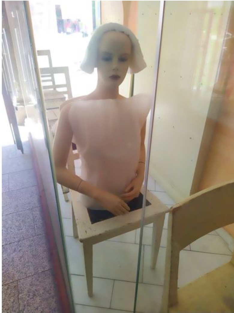
Der Oberkörper der Schaufensterpuppe auf dem Stuhl mit dem nachdenklichen Gesicht in der Galerie M am 29. Mai 2024