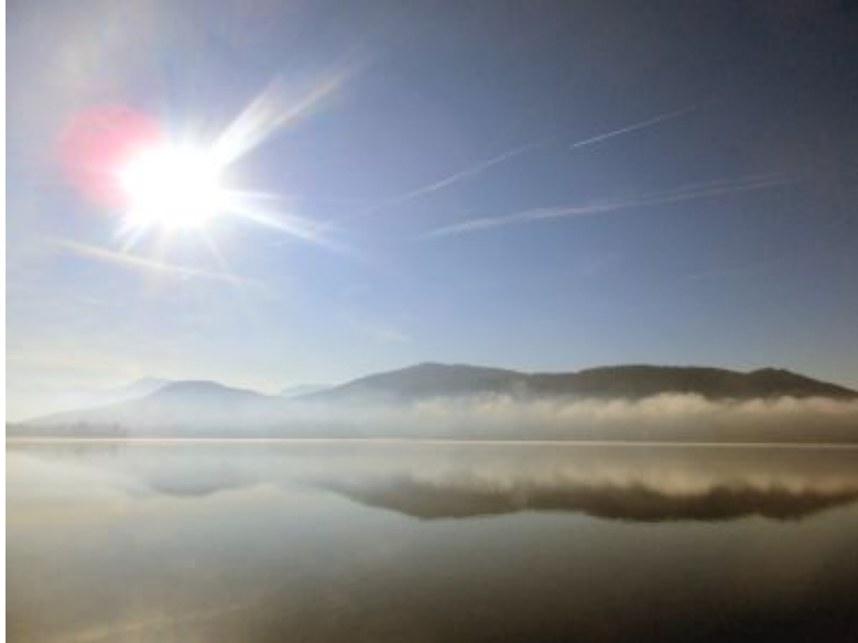
Die Sonne über dem Wörthersee mit dem Wolkenband am 15. Januar 2020

Dafür kann ich schlafen, wenn ich will, um meine Gedanken zu ordnen.