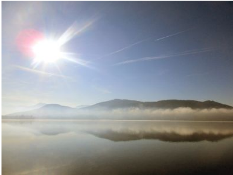
Die Sonne über dem Wörthersee mit dem Wolkenband am 15. Januar 2020

Dafür kann ich schlafen, wenn ich will, um meine Gedanken zu ordnen.