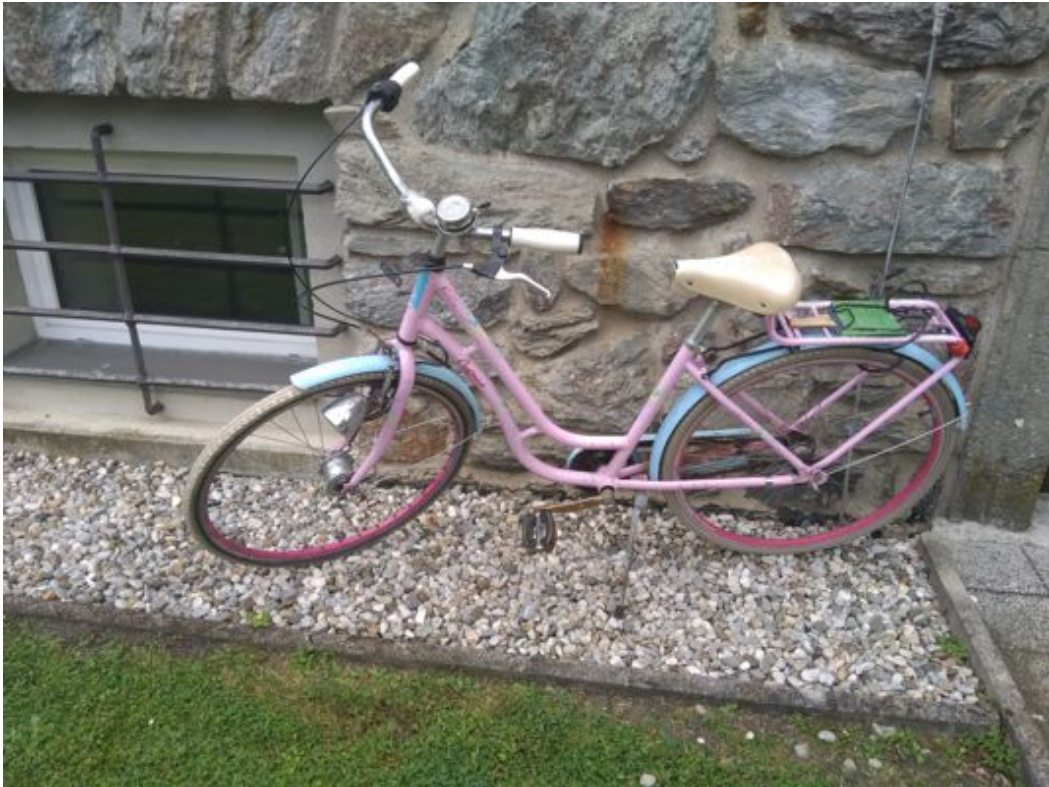
Altes Waffenrad in Pastellfarben