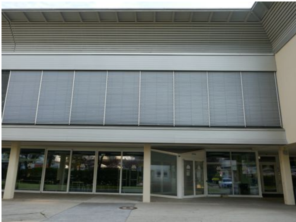
Die Uni-Mensa am Morgen des 16. August 2023, Nahaufnahme von Süden

Ich gehe zu meinem üblichen Platz im Hörsaal. Auf dem Pult liegt mein Federpennal – könnte man meinen. Aber es ist nicht meines, denn meines befindet sich noch in meinem Rucksack.