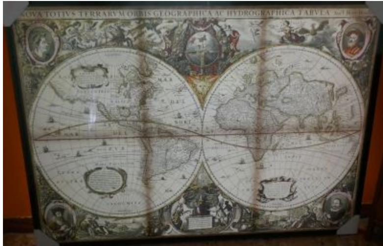
Die antike Weltkarte in zwei Schnitten

Das wird zurzeit immer mehr. Und ich werde dazu nicht schweigen.