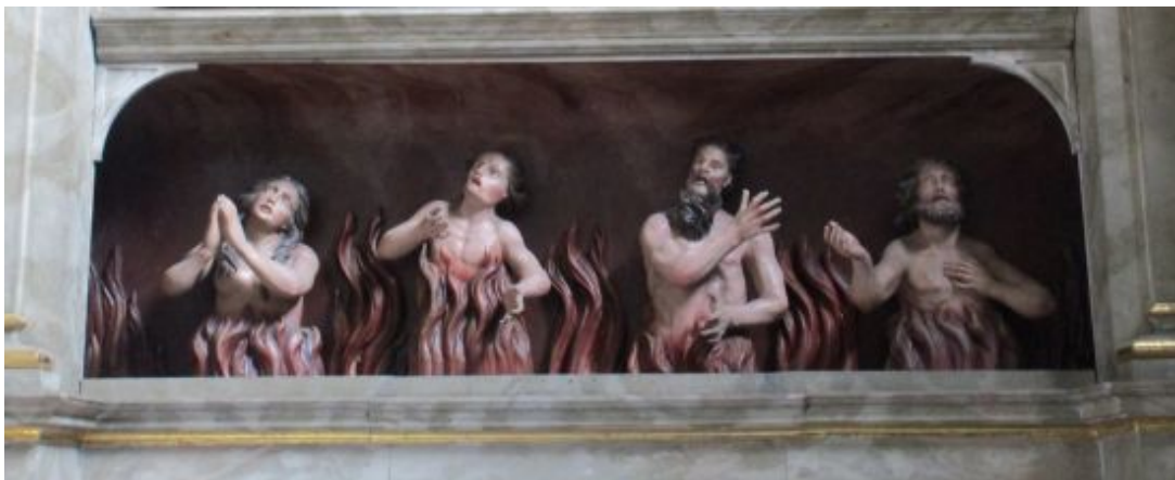
Zwei Sünderinnen und zwei Sünder im Fegefeuer in der Stadthauptpfarrkirche St. Egid

Die Sünde ist nicht bitter, ganz im Gegenteil. Sie ist klebrig und süß wie Honig, darum kosten alle so gerne von ihr. Ein bisschen Beten, dann seien dir deine Missetaten verziehen, darauf lässt sich jeder doch bereitwillig ein. Tugendhaft sein ist langweilig und grau, auch wenn man dafür in den Himmel kommt, aber noch ist es dazu zu früh. Das bunte Leben will gelebt werden, nicht irgendwann, sondern genau jetzt.