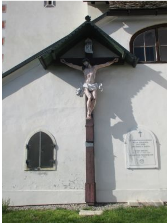
Jesus am Kreuz an der Kirche St. Martin