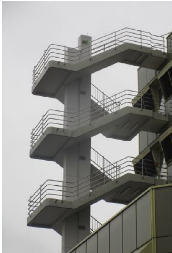
Freitreppen des A-1-Telekom- Gebäudes

Sie hat einen gewaltigen Hall. Offensichtlich bist du in einem sehr großen Gebäude. Es gibt keinerlei Hintergrundgeräusche. Ist das deine persönliche Hölle, die ewige Einsamkeit?