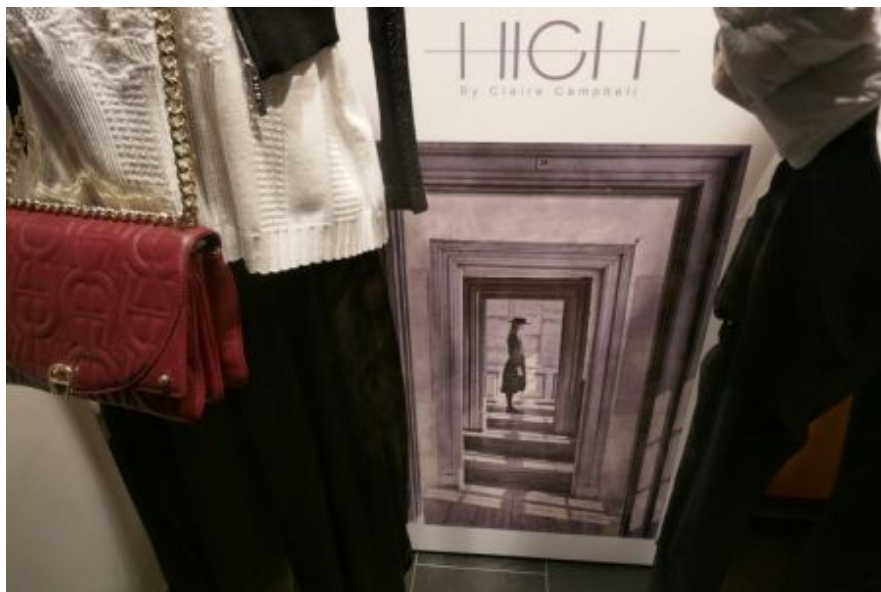
HIGH By Claire Campbell – Die Frau mit Hut hinter den Türen

Aber als es später läutete, ich öffnete, und du vor der Tür standst, hatte ich all das vergessen. So froh war ich, dass du endlich bei mir warst!