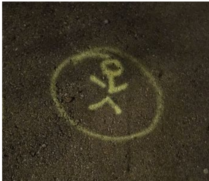
Das gelbe Strichmännchen im gelben Kreis in der Nacht des 1. Dezember 2025

Nun gehst du. Ich wünsch dir Glück auf all deinen Wegen. Zuversicht und Gottvertrauen, falls es dir hilft. Mögest du ankommen, wohin du strebst! Die Kraft sei mit dir. Wirst du manchmal an mich denken, den du zurückgelassen hast? Aber es geht hier um dich, nicht um mich. Meine Umstände werden ziemlich gleich sein, du hingegen bist der Wanderer ins wenig Berechenbare, ins wohl Ungewisse.