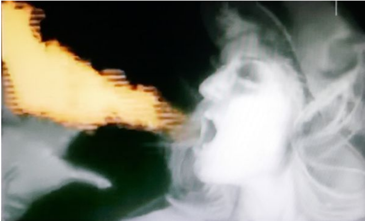
The lady starting to talk fire

wachsen empor wie ein Baum. „Das geht nicht!“, sagt sich Eva. „Ich muss die Gedanken verbrennen, sonst binden sie mein ganzes Denken. Ich kann kein Gefängnis in meinem Kopf brauchen. Was kann ich tun? Ist gar nicht so schwer, ich brauche Action!“