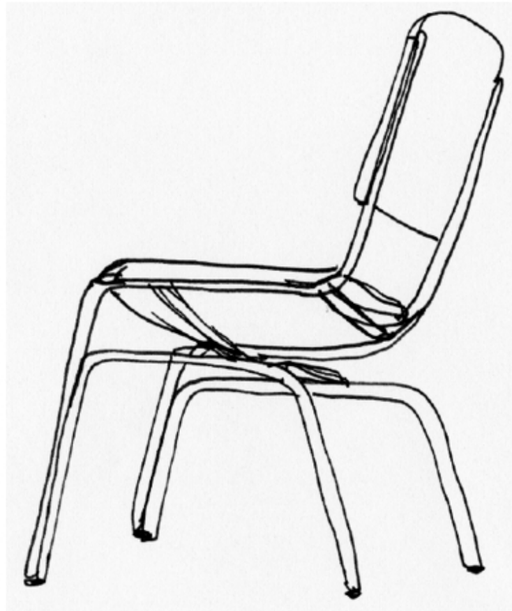
Grafik: Jannis Edelsbacher