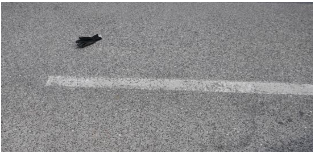
Der schwarze rechte Damenhandschuh auf dem Asphalt

Sie sprach so leise, du hast sie nicht verstanden. Doch dann zeigte sie: „Weg, weg, weg!“, mit ihrer rechten Hand. Das hast du sofort verstanden. Wie soll man das auch nicht verstehen?