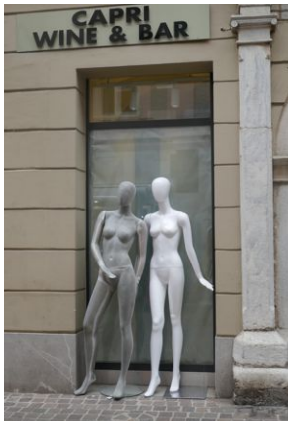
Die nackte graue und die nackte weiße Schaufensterpuppe bei CAPRI WINE & BAR am 24. Mai 2023

Das ist natürlich ganz und gar nicht wünschenswert, und die Natur in ihrer Perfektion richtet ein, dass es diesen Zustand nicht geben kann.