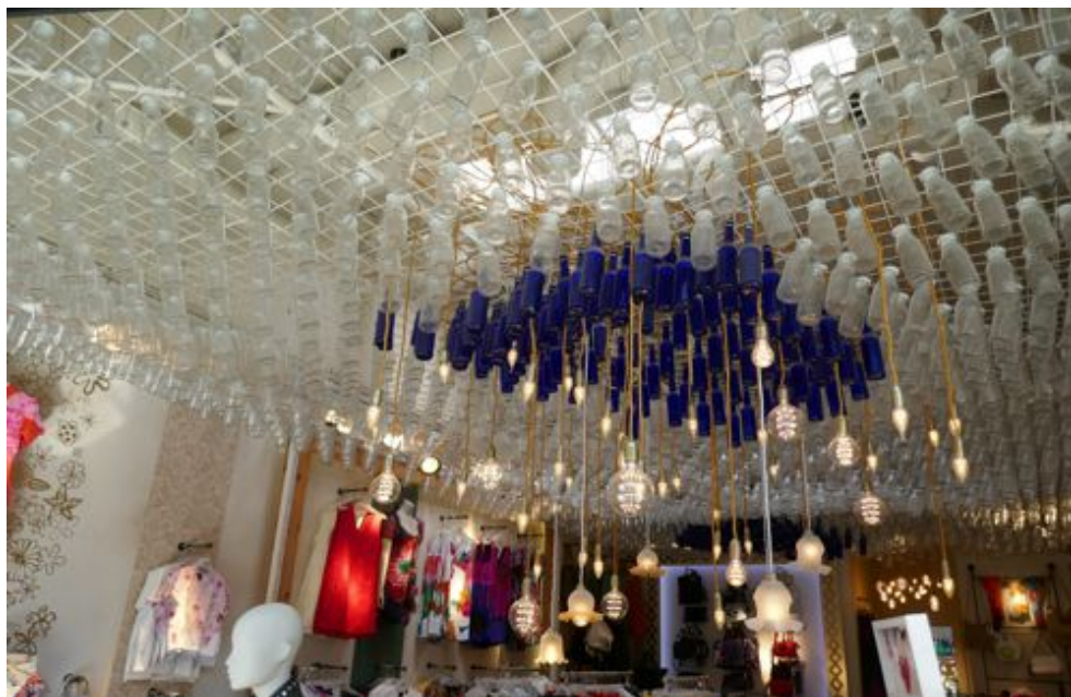
Hängende durchsichtige und dunkelblaue Flaschen im Südpark

In längstens zwei Minuten bist du nicht mehr hier, oder du bist hier, aber ich nehme dich nicht mehr wahr. „Komm zurück!“, würde ich dir gern zurufen, doch es wird nichts nützen.