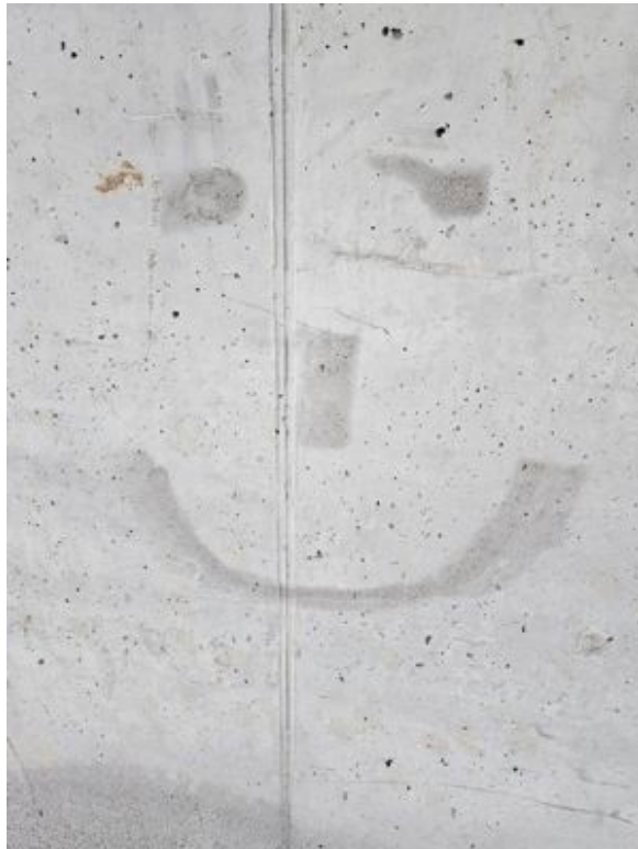
Das blasse lachende Gesicht

Das Gesicht, nicht meines, nicht deines, nicht ihres, nicht seines, das andere Gesicht, das fremde, das unbekannte.