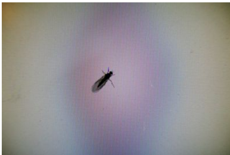
Das Insekt auf dem Computerbildschirm am 21. Mai 2022

„Aber dafür können Sie mich fernsteuern, wenn Sie wollen, nicht?“, stellt Herr Moser fest. „Ah, das stimmt“, sagt der Firmenvertreter.