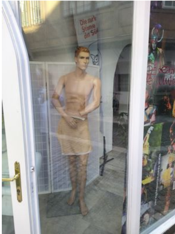
Die männliche Schaufensterpuppe mit Badehandtuch am 21. Februar 2024