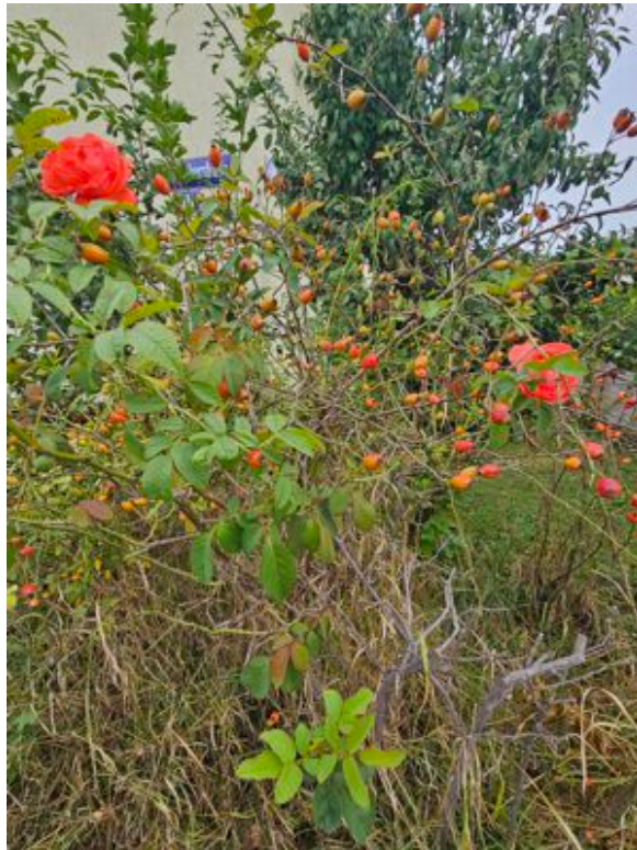
Rote Rosen und Hagebutten am 21. August 2024, Nahaufnahme

Ist es nicht egal, ob die Realität eine echte ist oder eine virtuelle? Wenn man niemals erwacht, ist es gleichgültig, weil man der Meinung ist, in der tatsächlichen zu leben. Eine kurze Bildstörung mag allerdings schon reichen, dass man bemerkt: Da stimmt etwas nicht. Die Wirklichkeit scheint dann durch, als schwarzer Fleck oder als Blumenstrauß. Eher wird es ein schwarzer Fleck sein, weil die virtuelle Realität schöner sein wird als die echte. Wozu sollte man sonst in sie flüchten?