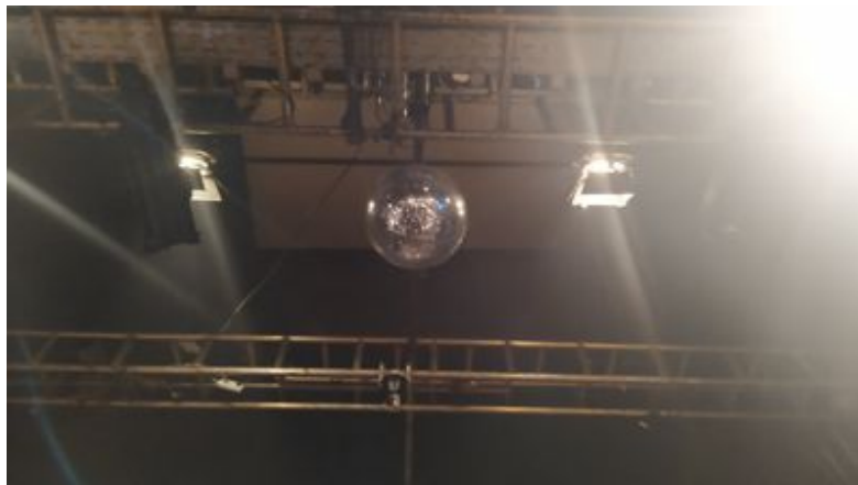
Die Discokugel in der Szene Wien am 6. Mai 2023

Danke, ich verzichte, da lebe ich lieber in einer Jurte in der Mongolei. Dort sind mir die Sterne nah.