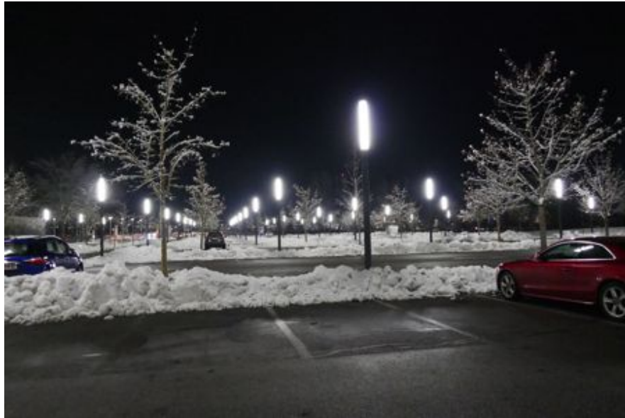
Die beleuchteten Parkplätze im Landeskrankenhaus Klagenfurt im Schnee des 21. Januar 2023

Der Arzt kappte die Verbindungen. Der Patient schwebte langsam hoch. Als er an der Decke angekommen war, lachte er, wie er in seinem Leben niemals gelacht hatte.