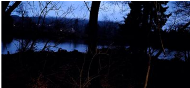
Der Osten des Kleines Sees frühmorgens am 29. November 2024

Sie fühlte sich großartig, nie hatte sie sich besser gefühlt. „Ich bin unbesiegbar“, leuchtete es grün in ihrem Elektronengehirn.