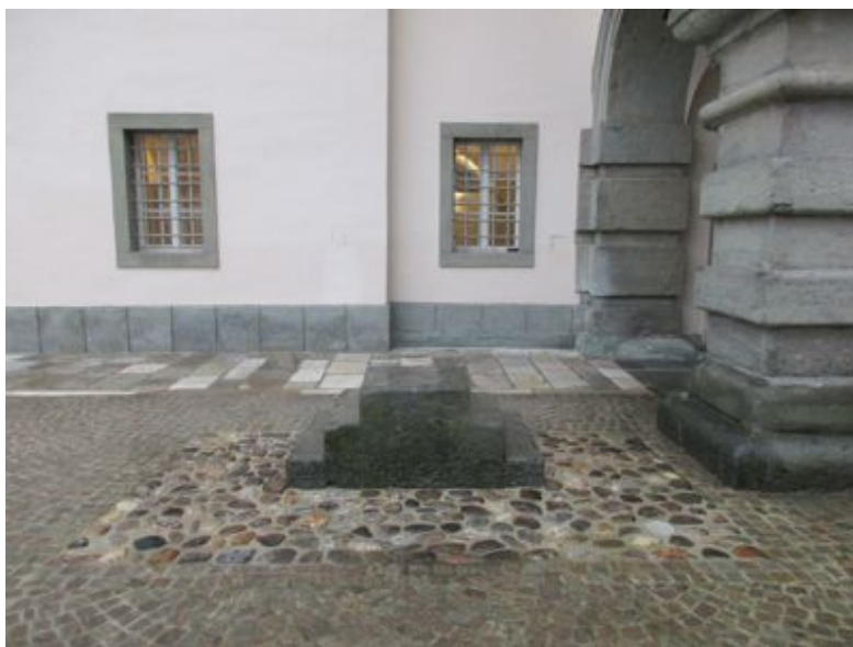
Das Doppeltreppchen auf dem Landhaushof

Von weit weg sehe ich mich selbst, während ich mich selbst als ein anderer von woanders sehe. Doch bin ich einer und nicht zwei.