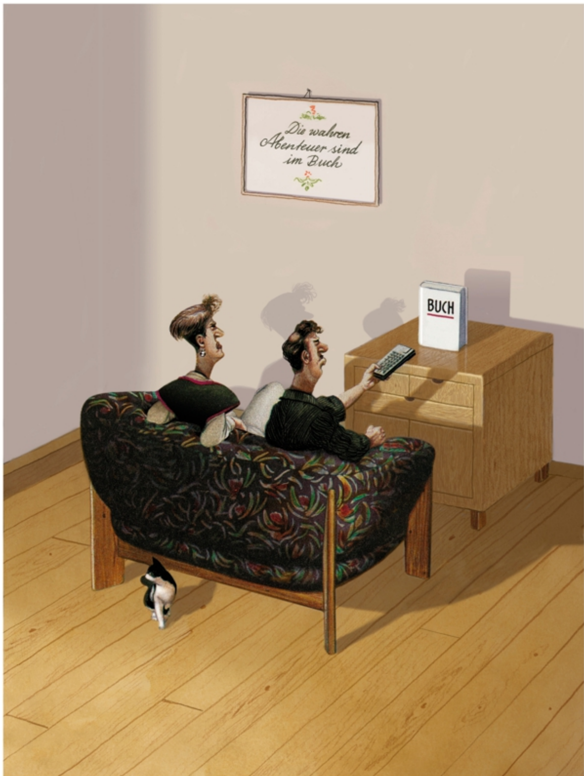
DAS INTERESSE AN BÜCHERN NIMMT WIEDER ZU

Copyright: Gerhard Haderer, Scherz & Schund Fabrik e.U.